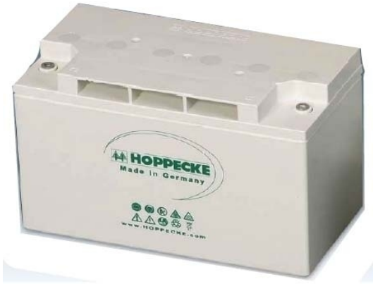
Разряд постоянной мощностью

U_{\text{кон}} = 1.7 \text{ В/эл-т} T = 20^\circ\text{C}